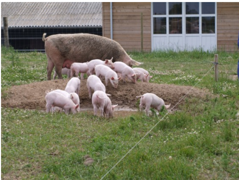
Figur 1. Om sommeren skal avlsdyr have adgang til græsningsarealer og temperaturregulering, dvs. sølebad.

Vil du vide mere om mulighederne for økologi på din bedrift? Rådgivningen tilbyder såkaldte "omlægningstjek". Det er besøg, hvor en økologisk planteavlskonsulent (Det er typisk er dem, der udfærdiger en autorisationsansøgning) samt endnu en økologisk fagkonsulent deltager. Besøgets formål er at give landmanden en hurtig briefing på vilkårene og konsekvenserne af en omlægning af bedriften.